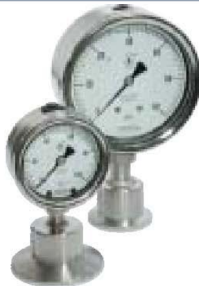
Serie 10 uso rudo