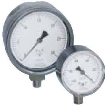
Serie 200 Baja presión