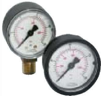
Serie 100 estándar