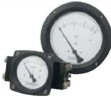
Serie 1100 Diafragma