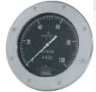
Serie 1300 Membrana