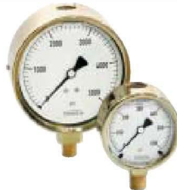
Serie 300 Cast brass