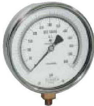
Serie 800 De precisión