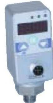
Serie 700 electrónicos