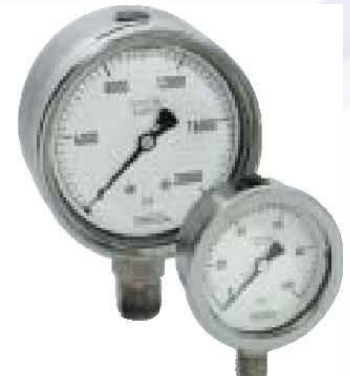
Serie 400(seco) y 500(líquidos) en acero inoxidable