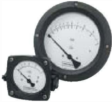
Serie 1000 pistón