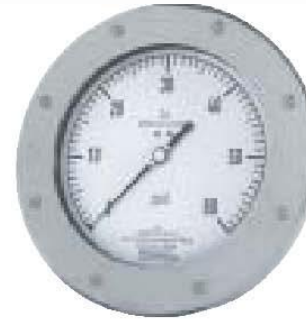
Serie 1200 membrana