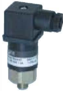
Serie 300 mecánicos de presión