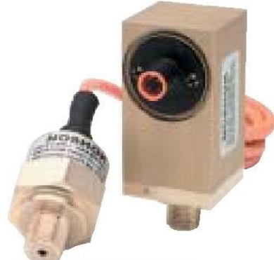
Serie 500 magnéticos