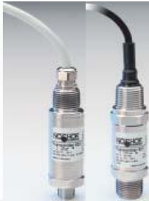
Series 621 a 624