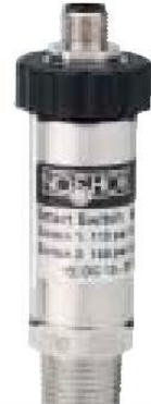
Serie 600 inteligentes